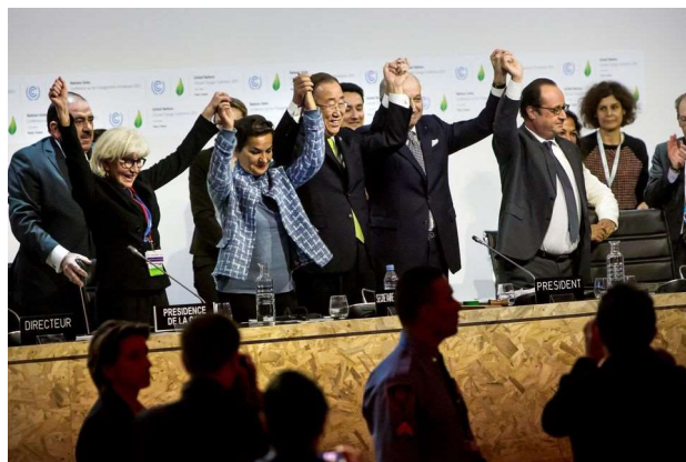
Adoption de l'Accord de Paris