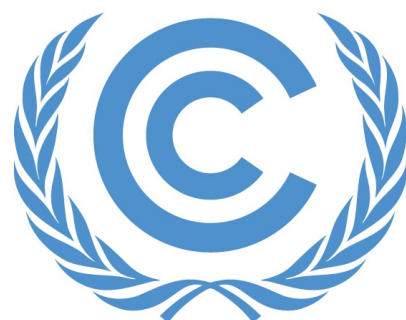
United Nations Framework Convention on Climate Change